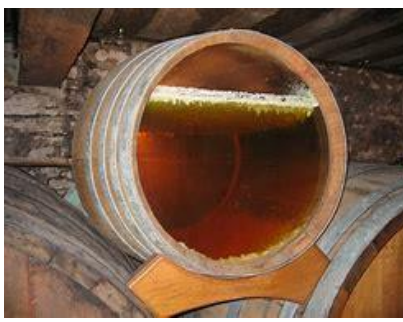
L'élevage sous voile