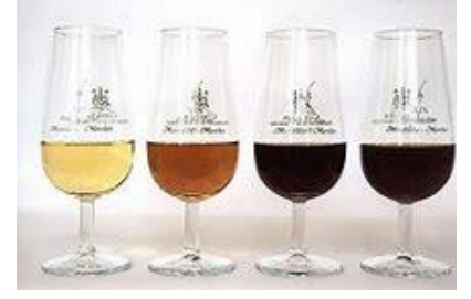
La grappe du Pedro Ximenez et son brunissement au cours de son processus d'élevage en milieu oxydatif