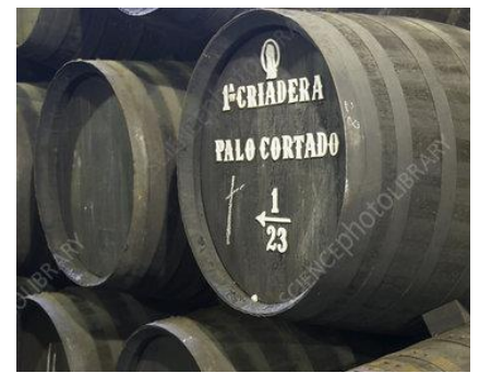
Le signe du bâtonnet barré