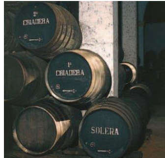
Le système de la solera