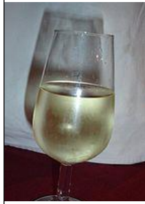
La grappe généreuse du palomino et la couleur pâle de son vin